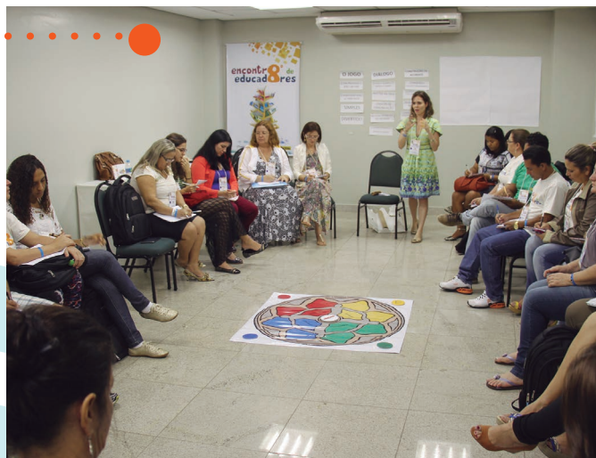
Educadores atentos na oficina Mandala

Os coordenadores que se interessarem em capacitar os seus educadores para a realização da Oficina com as crianças e os adolescentes poderão solicitar o kit Mandala das Relações Educativas à FENABB, a partir de agosto de 2014. Os kits serão disponibilizados no sistema de empréstimo.