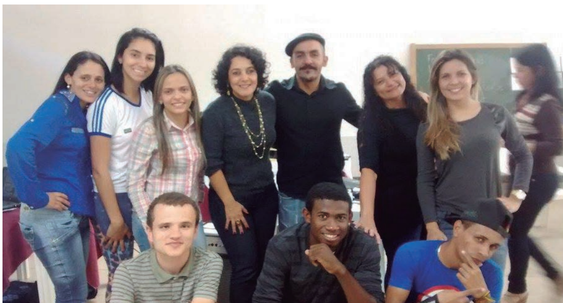
Manhuaçu (MG) foi uma das cidades a receber o curso

Capacitar educadores sociais para atuar no AABB Comunidade. Foi com este objetivo que, no primeiro semestre de 2014, foram ofertadas 10 turmas do Curso Educador Social AABB Comunidade. Ação formativa e de extrema importância para quem atua junto às crianças e aos adolescentes atendidos pelo Programa, o Curso foi realizado em diferentes cidades, capacitando aproximadamente 200 educadores sociais.