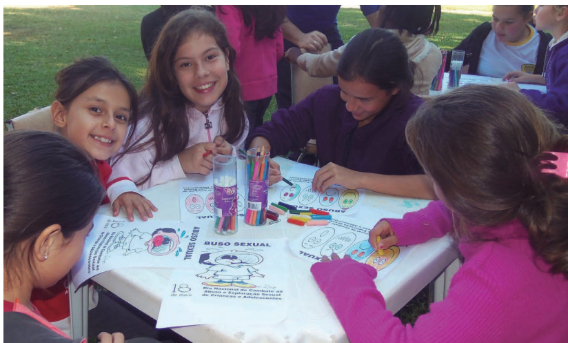
Crianças e adolescentes estão atentos ao tema