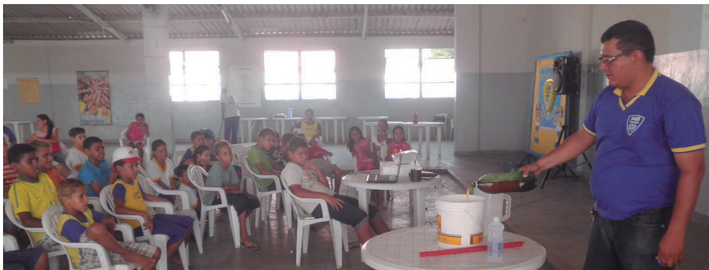
A atividade contou com demonstração prática

é buscar nas comunidades óleo de cozinha usado e transformá-lo em sabão. A iniciativa, ao instruir sobre as possibilidades de reaproveitamento de resíduos, favorece a conscientização sobre cuidados ambientais.