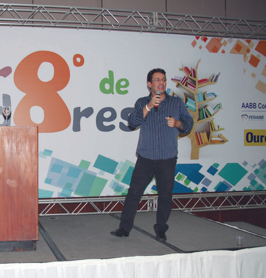
Novas perspectivas sobre sexualidade