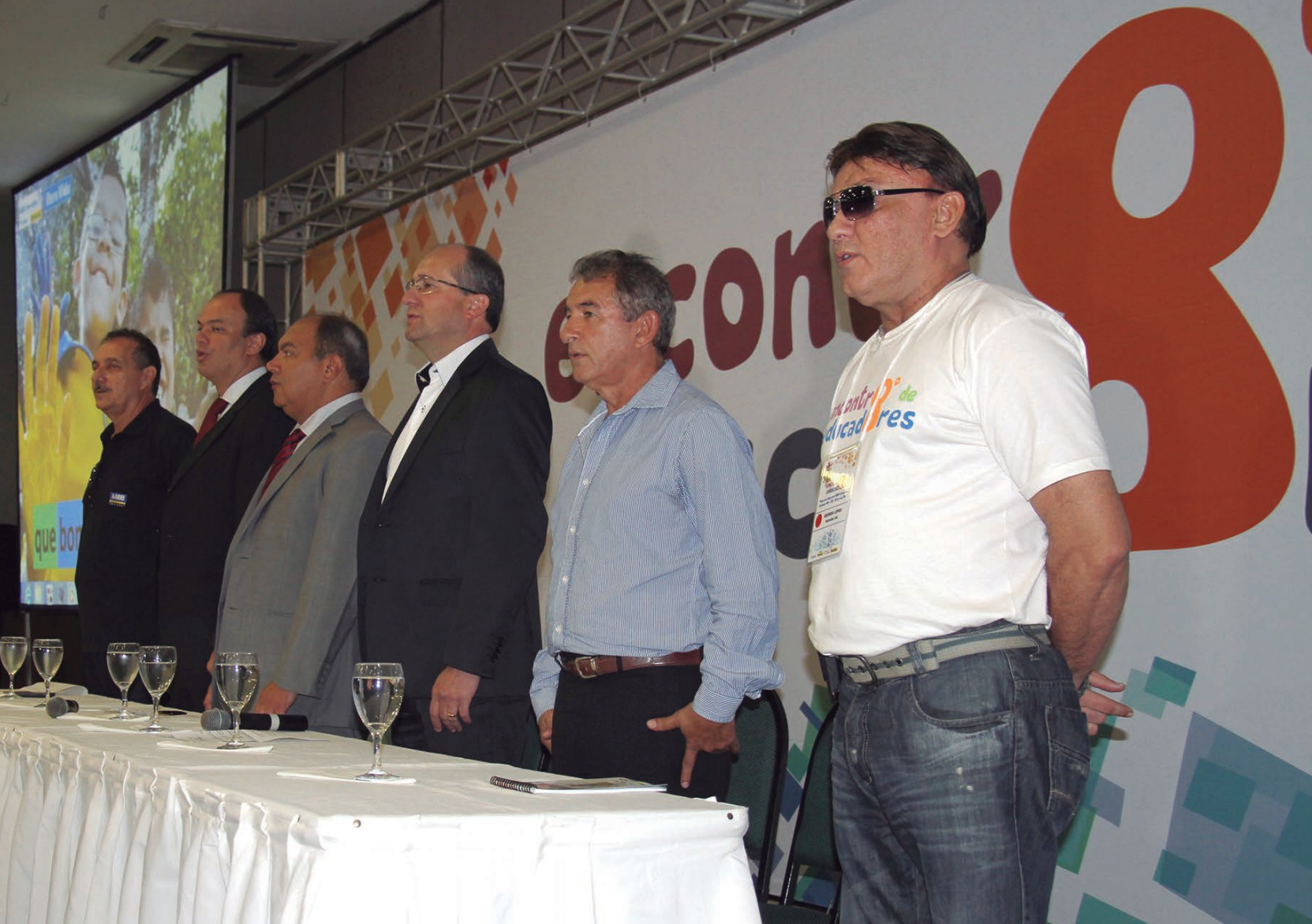
Abertura do Encontro reúne autoridades do Banco do Brasil, FENABB e da Fundação Banco do Brasil