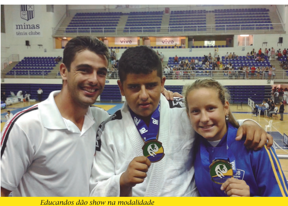
Educandos dão show na modalidade