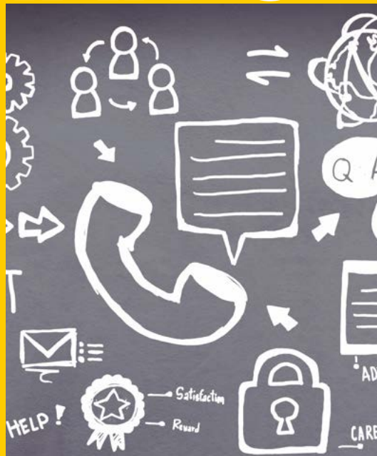
Envio da cartilha viva melhor