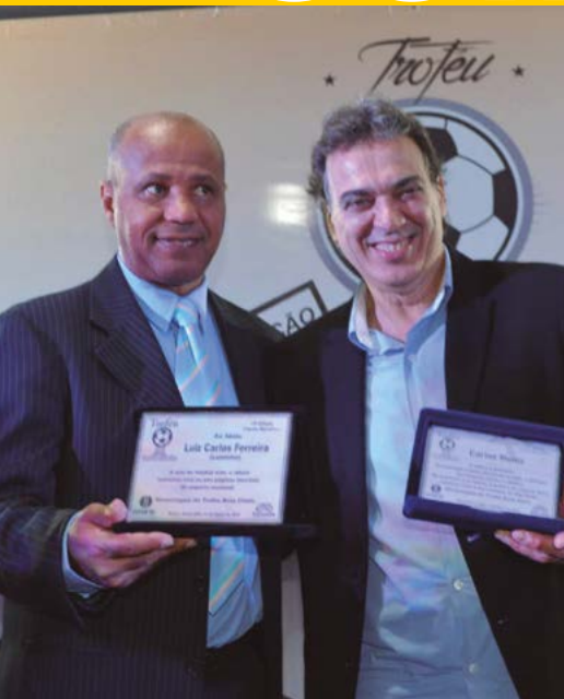
AABB Comunidade Montes Claros (MG) recebe prêmio