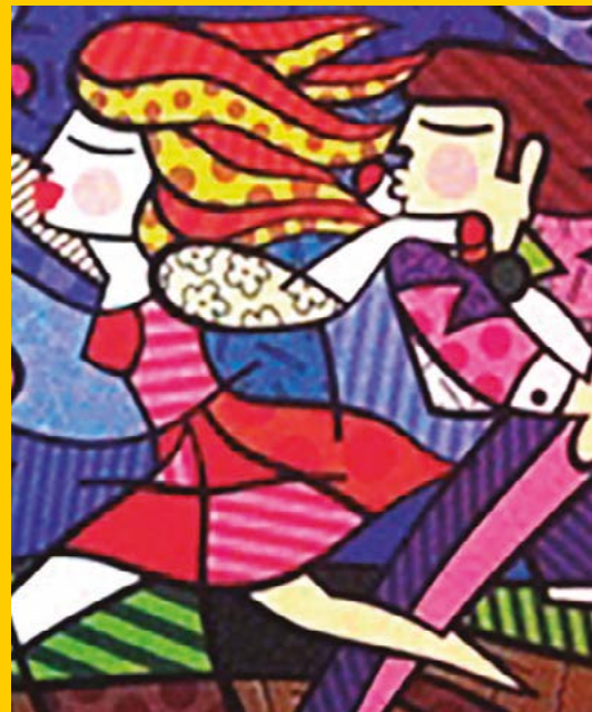
Canais de atendimento do Programa