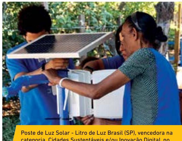
Poste de Luz Solar - Litro de Luz Brasil (SP), vencedora na categoria Cidades Sustentáveis e/ou Inovação Digital, no Prêmio Fundação Banco do Brasil de Tecnologia Social 2017

Projeto: Arranjo de Tecnologias Sociais de abastecimento de água para comunidades ribeirinhas da Amazônia