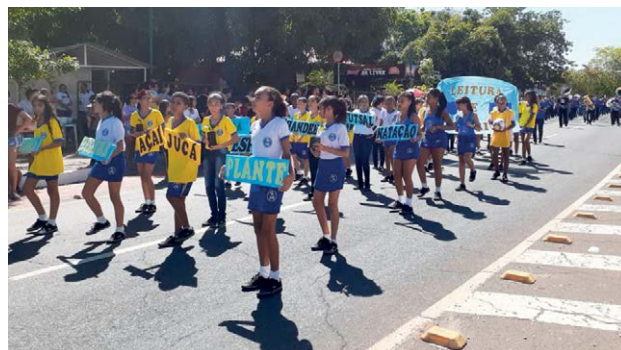
AABB Comunidade Teresina (PI)

Como tradição, há mais de 30 anos, os educandos do município de Cristalina marcaram presença no desfile cívico. Trajado com o uniforme do Programa, o grupo percorreu as principais ruas da cidade levando as faixas com as marcas da FENABB e AABB Comunidade.