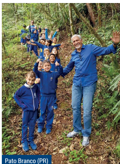
Pato Branco (PR)