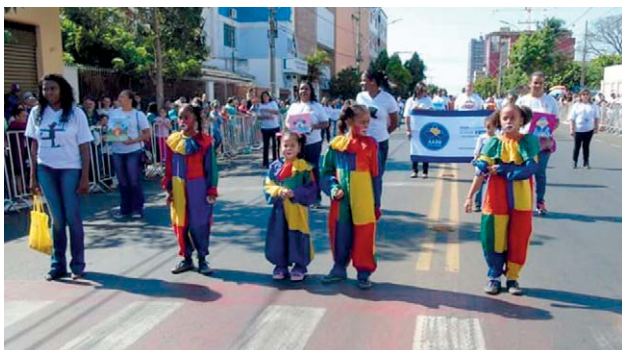
AABB Comunidade Araxá (MG)

Datas comemorativas são ocasiões especiais, em que os AABBs Comunidade demonstram a sua magia, sejam em celebrações sociais, esportivas e/ou culturais. Tendo como comparativo, no Dia da Independência (7 de Setembro), os educandos expressaram, de maneira singela o patriotismo na programação dos desfiles cívicos. Já no 12 de outubro, Dia das Crianças, a diversão e atividades recreativas foram os pontos de destaque das ações realizadas em diferentes localidades. A seguir, selecionamos alguns Programas que aproveitaram as ocasiões em grande estilo.