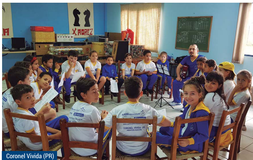
Coronel Vivida (PR)