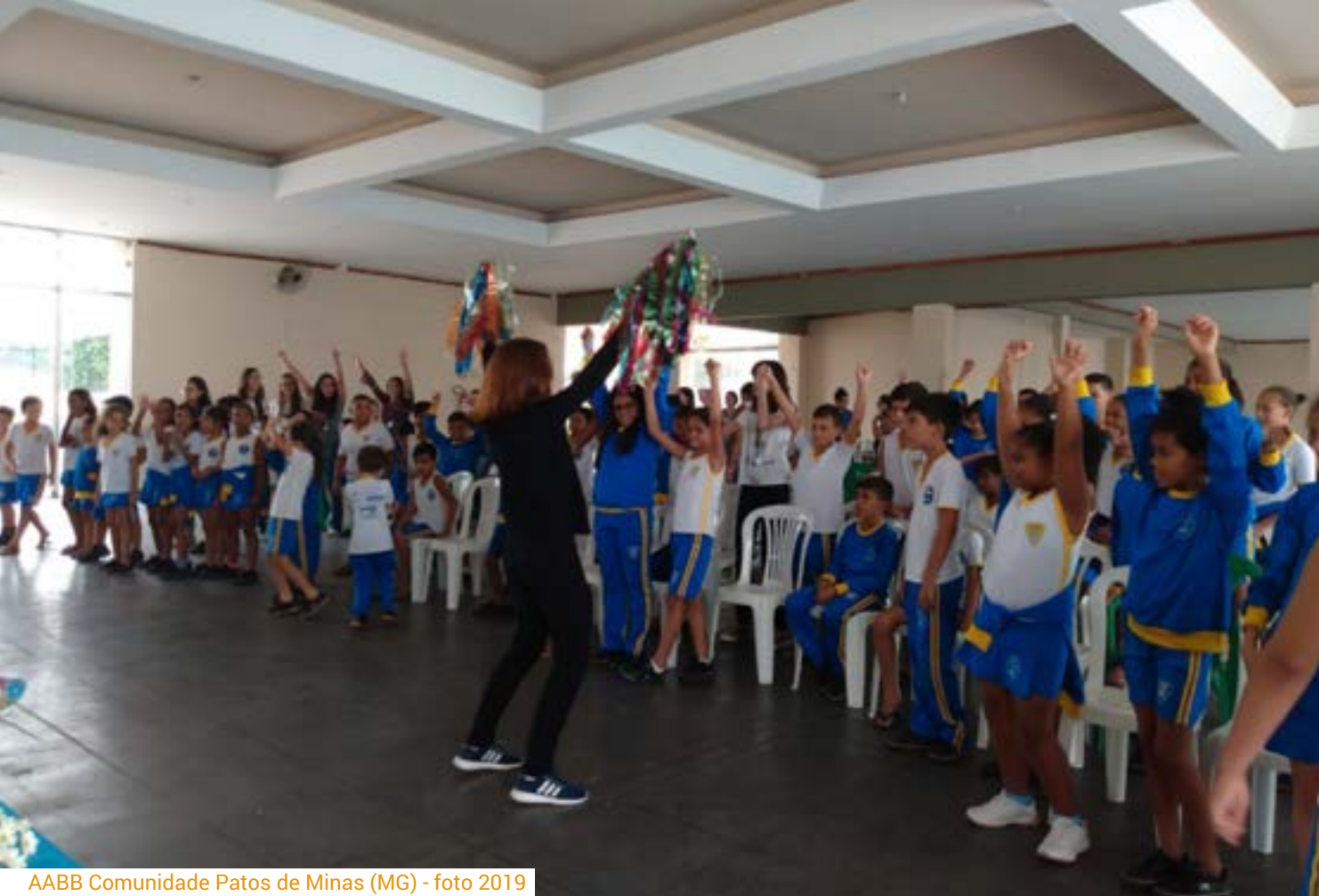
AABB Comunidade Patos de Minas (MG) - foto 2019