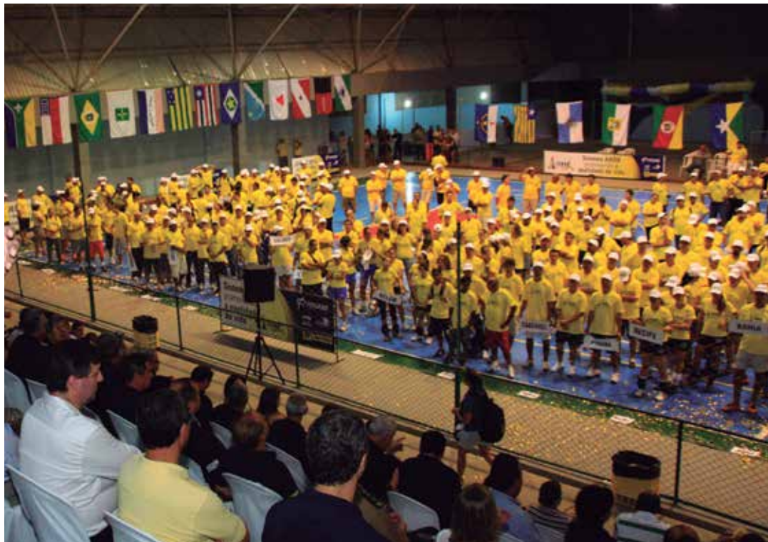
680 ATLETAS PERFILADOS DURANTE DESFILE DE ABERTURA DA JENAB