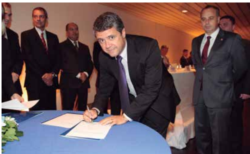
PRIMEIRO SUPLENTE DA DIRETORIA ASSUME VICE-PRESIDÊNCIA NA FENABB

“A vice-presidência Administrativa é, hoje, responsável por coordenar os processos internos da Federação, com vistas a auxiliar as AABBs em algumas demandas pontuais, como aquisição de produtos e parcerias com empresas fornecedoras de materiais, como móveis para piscina, entre outros. Além disso, com a reestruturação interna pela qual a FENABB está passando, a VIPAD também responderá pelas áreas de informática e jurídica. Nesse sentido, tem sido interessante poder auxiliar os clubes em suas demandas e, o que é melhor, ver que esse trabalho contribui