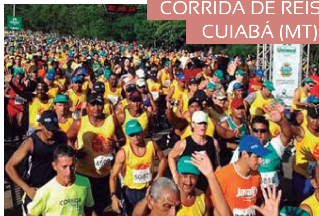
CORRIDA DE REIS CUIABÁ (MT)

“Fiquei feliz, após contatos com colegas da CASSI e GEPES, com repercussão positiva causada”.