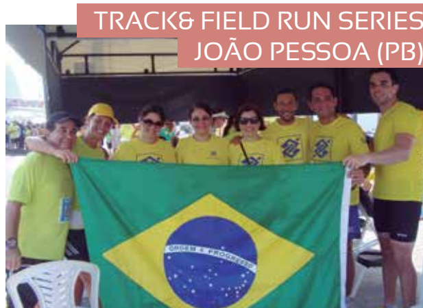
TRACK & FIELD RUN SERIES JOÃO PESSOA (PB)