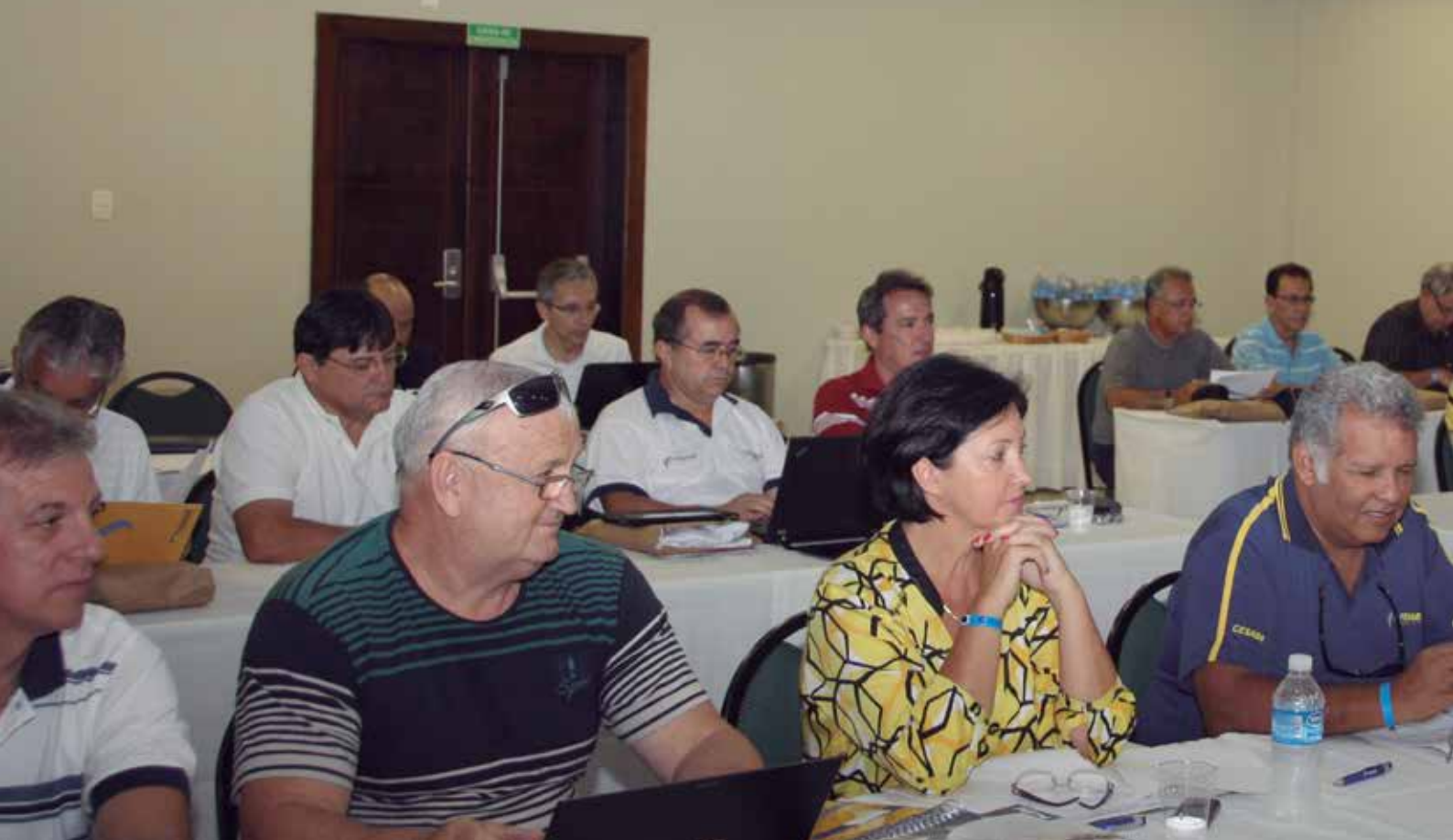
PRESIDENTES DOS CESABBs NA PRIMEIRA REUNIÃO ORDINÁRIA DO ANO