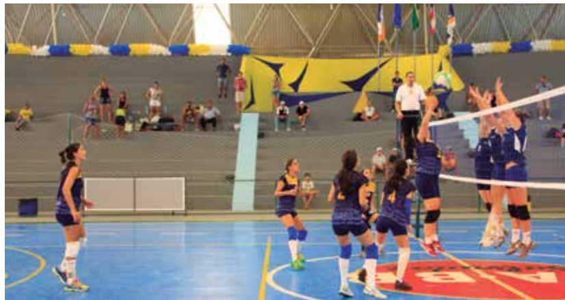
VOLEIBOL FEMININO FOI UM DOS DESTAQUES DA COMPETIÇÃO

Após a abertura oficial da JENAB, os convidados tiveram a chance de apreciar a boa música e o suingue da baianíssima Margareth Menezes, que marcou presença com sucessos da sua carreira. Outro ponto alto da competição, desta vez no encerramento, foi a presença do embaixador do esporte do Banco do Brasil Anderson Rodrigues, ouro nos Jogos Olímpicos de Atenas, em 2004, prata na Olimpíada seguinte, em Pequim, e hexacampeão da Liga Mundial (2001/2003/2004/2005/2006/2007).