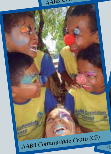
AABB Comunidade Crato (CE)