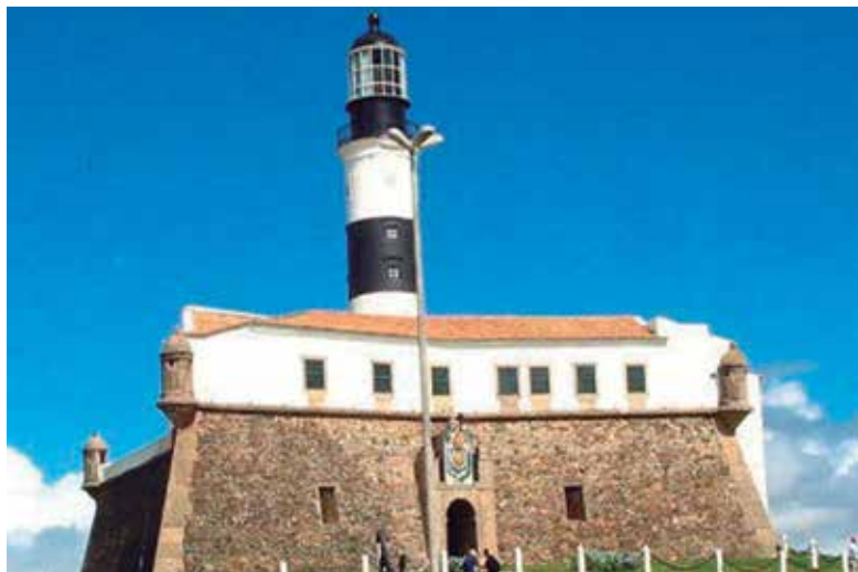
Farol da Barra, Salvador (BA)