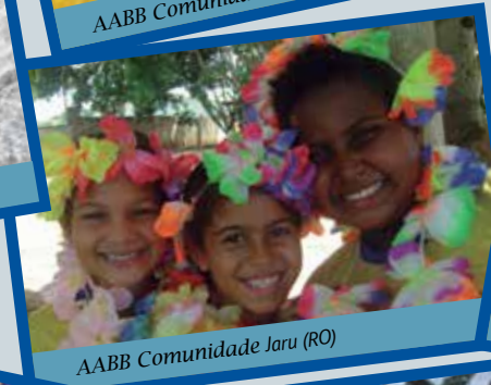
AABB Comunidade Jaru (RO)