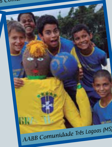
AABB Comunidade Três Lagoas (MS)