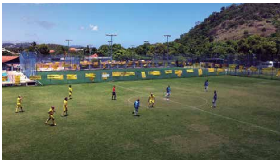
Futebol: uma das modalidades mais populares da competição