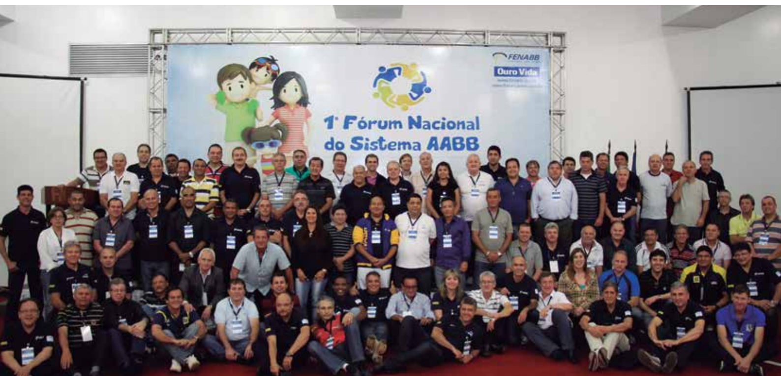
Evento favoreceu a troca de experiências entre Banco do Brasil, FENABB e dirigentes