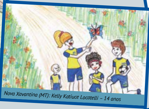
Nova Xavantina (MT): Kelly Katiuce Locatelli - 14 anos