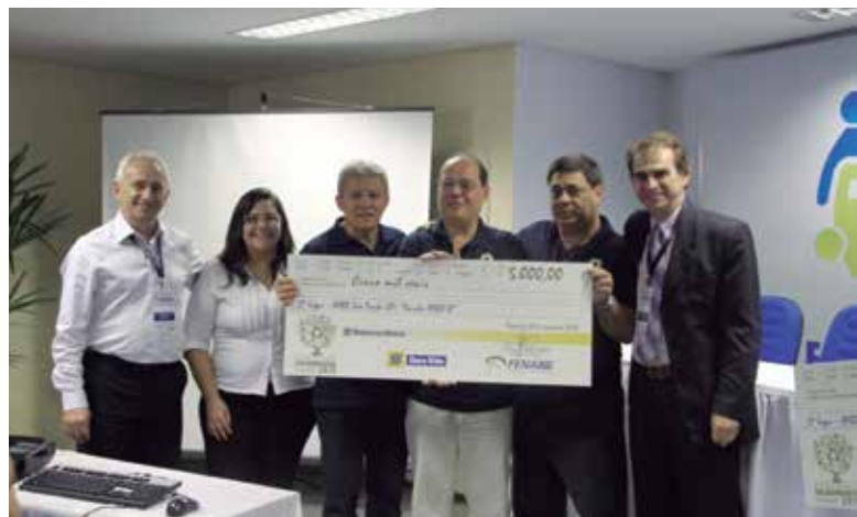
Representantes da AABB São Paulo (SP)

No site da FENABB, a partir da palavra-chave Concurso, você encontra todos os projetos encaminhados.