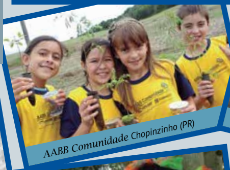
AABB Comunidade Chopinzinho (PR)