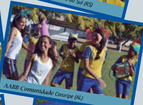
AABB Comunidade Coruripe (AL)