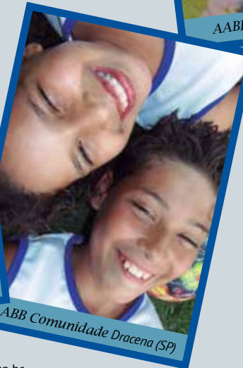
AABB Comunidade Dracena (SP)