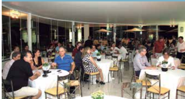
Jantar de Confraternização na Pérgola da AABB