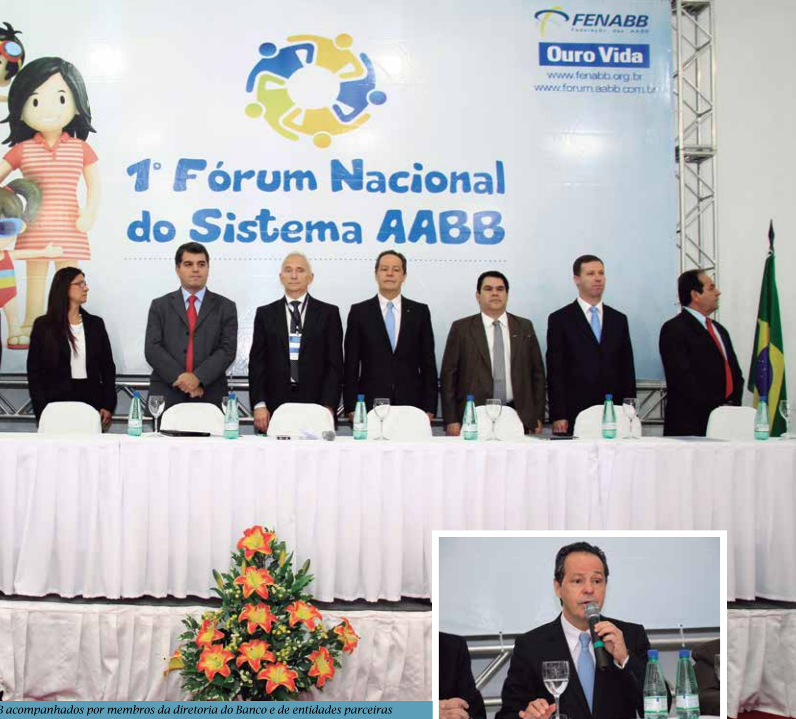
acompanhados por membros da diretoria do Banco e de entidades parceiras