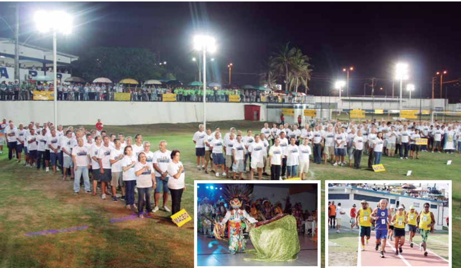
Atletas aposentados dão exemplo de vida para demais membros da família abebeana