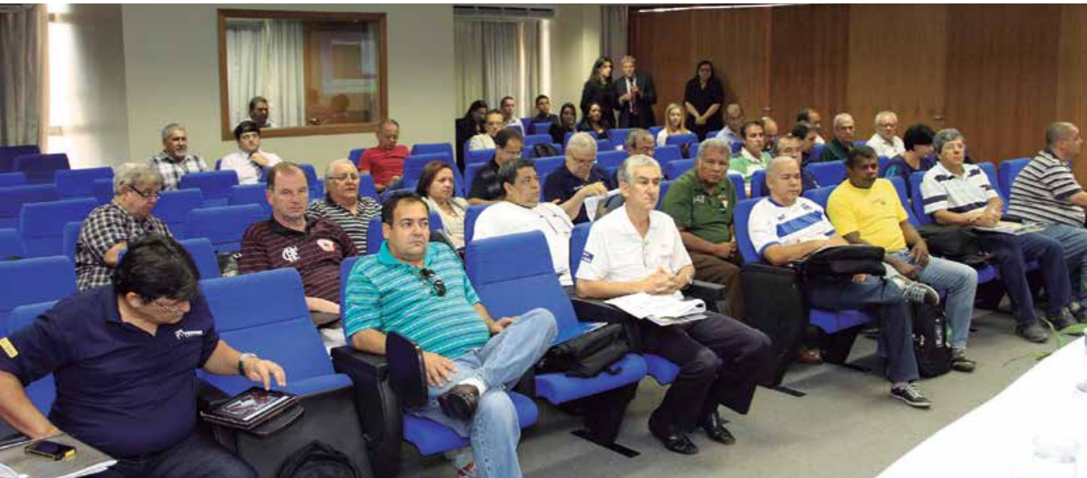
Conselheiros atentos aos trabalhos do dia