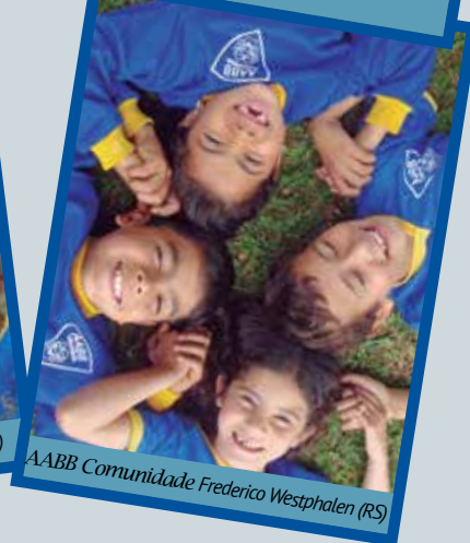
AABB Comunidade Frederico Westphalen (RS)