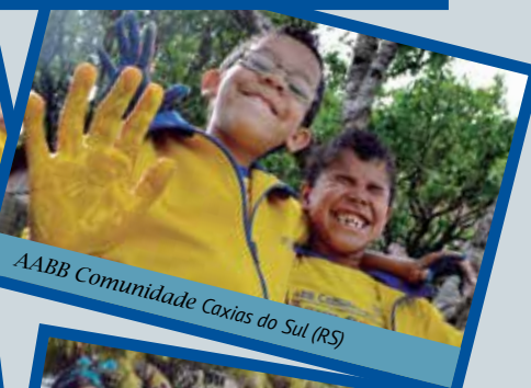
AABB Comunidade Coxias do Sul (RS)