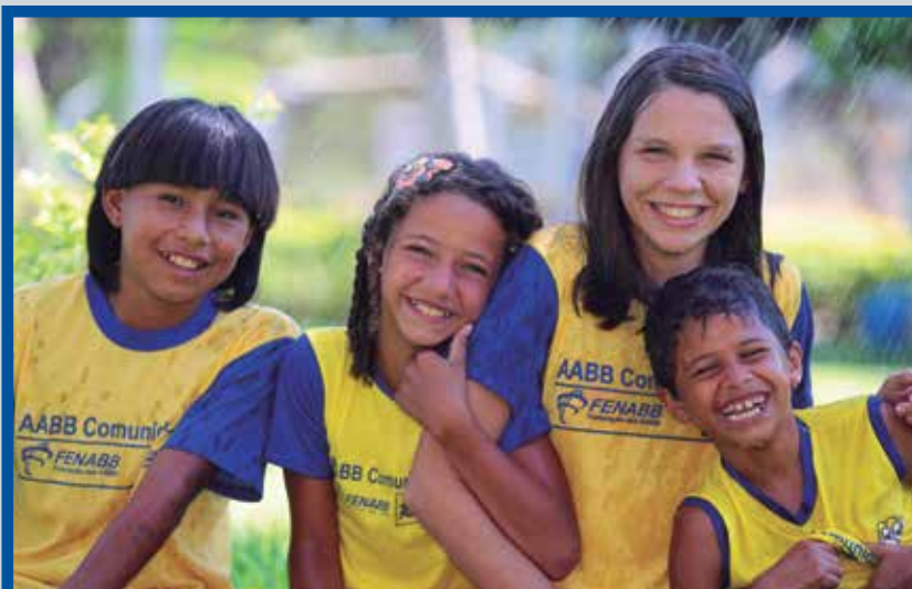
1º Lugar - Nova Xavantina (MT)

Na seleção das fotos e desenhos foram contemplados pelo menos uma foto e um desenho de cada região do país. No caso das fotos, a AABB que ficou em 1º lugar levou um Ultrabook e estampou a capa da agenda. As menções honrosas receberam um Projetor Multimídia. No caso dos desenhos, todos os educandos que tiveram seus desenhos selecionados serão contemplados com um Smartphone.