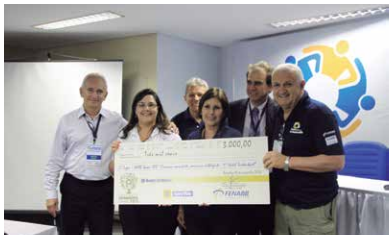
Representantes da AABB Itaqui (RS)