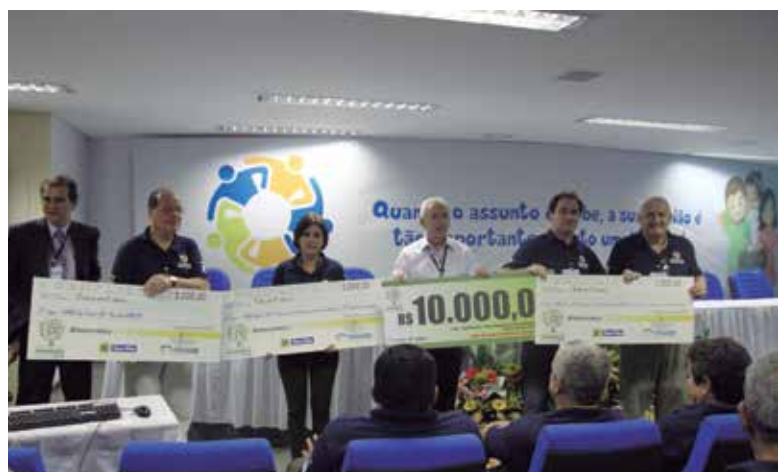
Representantes da AABB Marau (RS) e demais vencedores