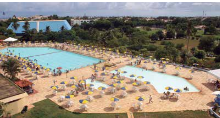
AABB Salvador (BA)