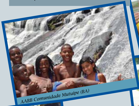
AABB Comunidade Mutuípe (BA)