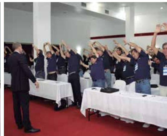
Dinâmica de Trabalho com Libardi