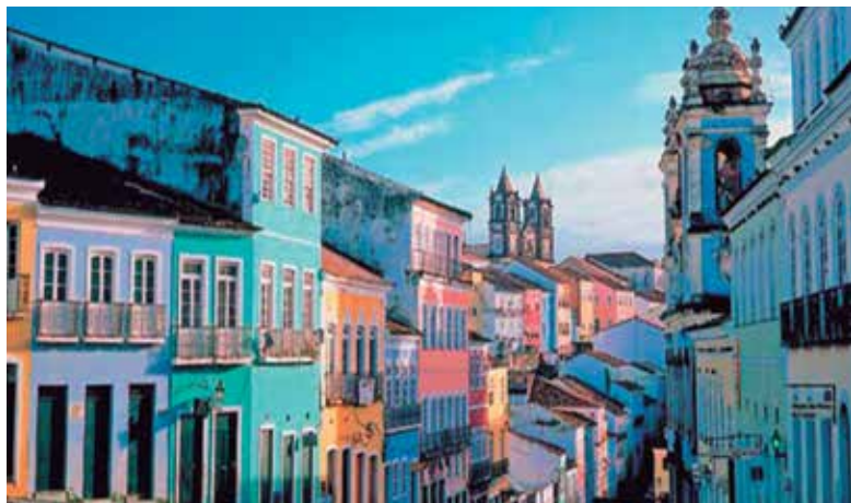
Pelourinho, Salvador (BA)

O CINFAABB conta com o apoio das entidades de funcionários e do próprio Banco do Brasil.