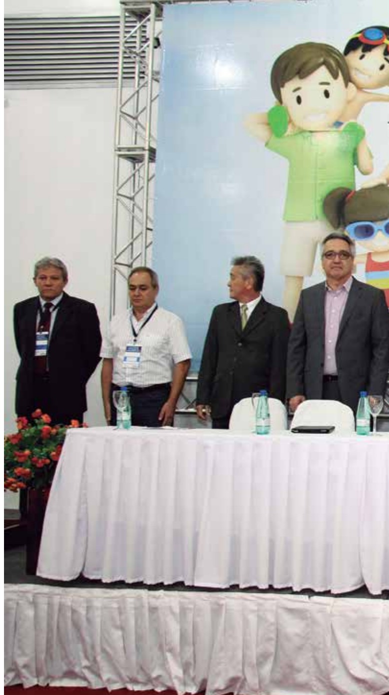
Presidentes do Conselho de Administração, Fiscal e Deliberativo da FENABB