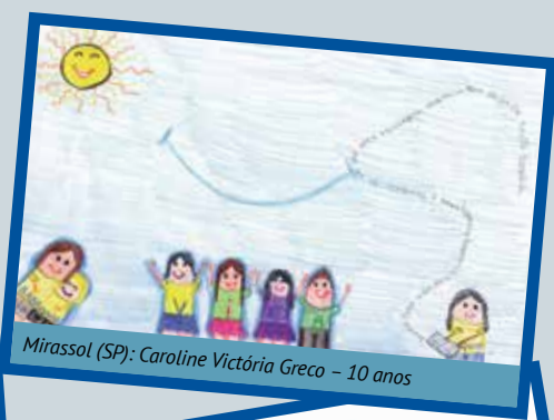
Mirassol (SP): Caroline Victória Greco - 10 anos