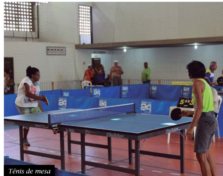
Tênis de mesa