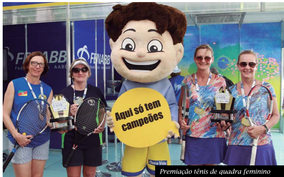
Premiação tênis de quadra feminino