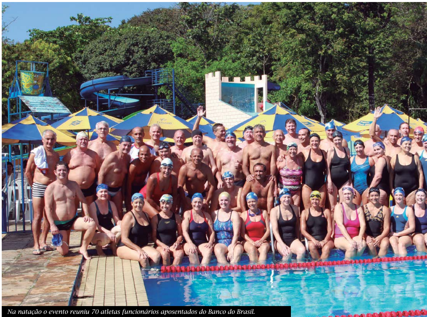
Na natação o evento reuniu 70 atletas funcionários aposentados do Banco do Brasil.