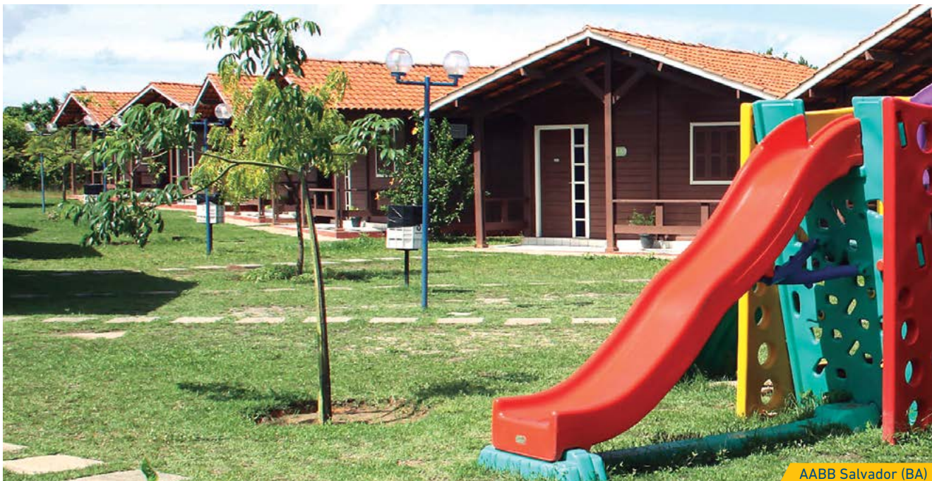
AABB Salvador (BA)

táveis acomodações com varanda, sala, cozinha, suíte, ar-condicionado, geladeira, fogão, armários e utensílios de cama, mesa e banho. E a estrutura física dos próprios clubes garante o lazer e a recreação que você e sua família merecem.