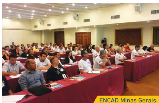
ENCAD Minas Gerais