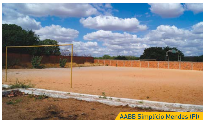
AABB Simplício Mendes (PI)