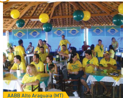
AABB Alto Araguaia (MT)