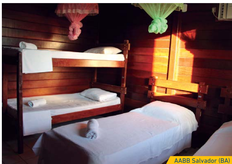
AABB Salvador (BA)