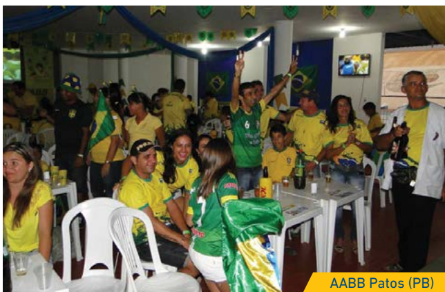
AABB Patos (PB)