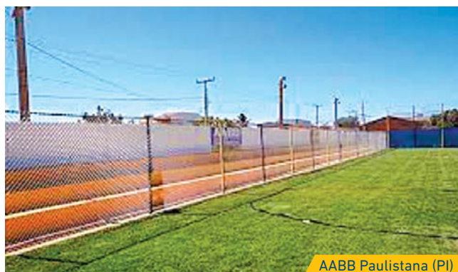
AABB Paulista (PI)