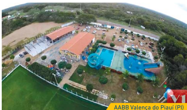
AABB Valença do Piauí (PI)

RESULTADO: antes mesmo de concluída a obra, a AABB já era uma das maiores do Estado, com 500 associados no seu quadro.