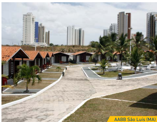
AABB São Luís (MA)