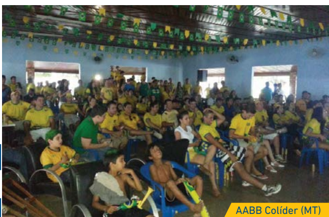
AABB Colíder (MT)