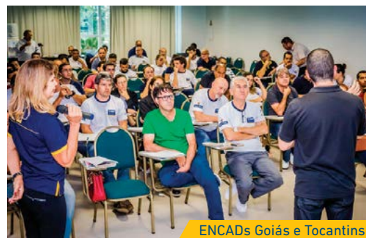
ENCADs Goiás e Tocantins