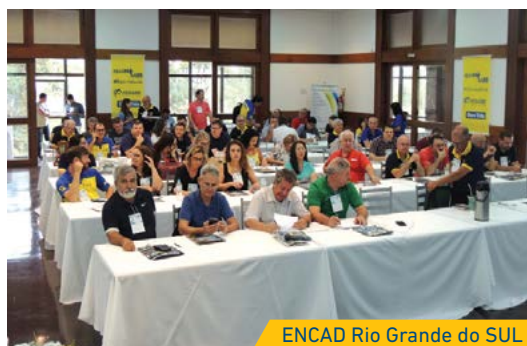
ENCAD Rio Grande do SUL