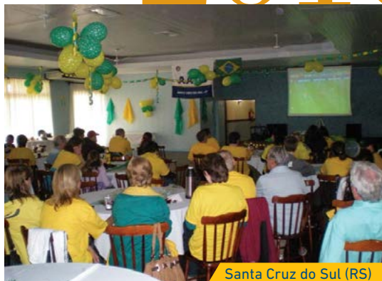
Santa Cruz do Sul (RS)