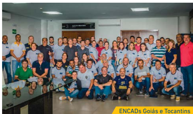
ENCADs Goiás e Tocantins

“Fortalecemos nossos trabalhos no que diz respeito à unicidade e direcionamento para que os clubes tenham um papel cada vez mais importante junto ao funcionalismo e à comunidade. Conseguimos alinhar estratégias que envolvem a SUPER, a FENABB, as agências e