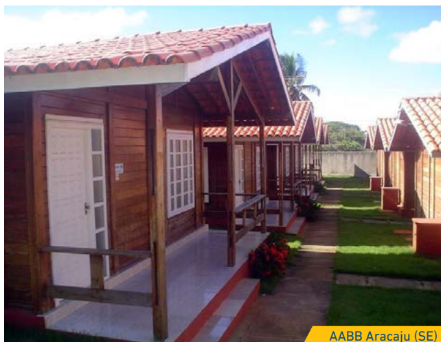
AABB Aracaju (SE)