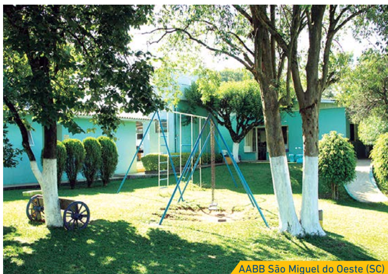
AABB São Miguel do Oeste (SC)

No Sistema AABB, alguns clubes disponibilizam áreas destinadas ao Camping. Esses locais são próximos à natureza e proporcionam ao acampante amplo contato com o meio ambiente. Além, claro, deles poderem usufruir de toda a estrutura de lazer do clube. A área, em sua maioria, tem estrutura com banheiros com chuveiros, espaço para barracas e acesso às churrasqueiras.