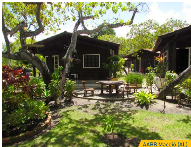
AABB Maceió (AL)