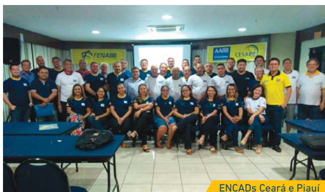
ENCADs Ceará e Piauí