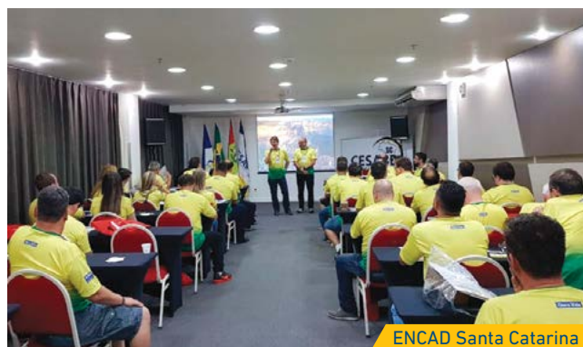
ENCAD Santa Catarina