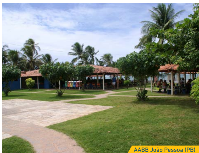
AABB João Pessoa (PB)