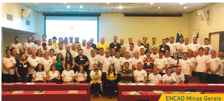
ENCAD Minas Gerais