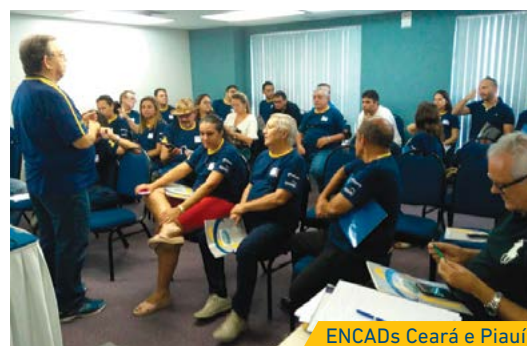
ENCADs Ceará e Piauí