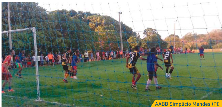
AABB Simplício Mendes (PI)

Para Vanduil o apoio do CESABB e FENABB, não só financeiramente, mas também com orientações, sempre foram fundamentais para os resultados obtidos: “O suces-