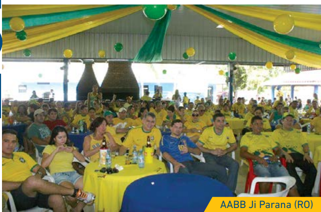
AABB Ji Parana (RO)