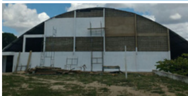
Quadra na AABB Limoeiro - Em plena reforma