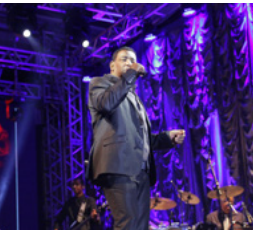
Canções como 'Maravilha' arrancaram aplausos

A cobertura completa do evento, com galeria de imagens, encontra-se em: www.fenabb.org.br .