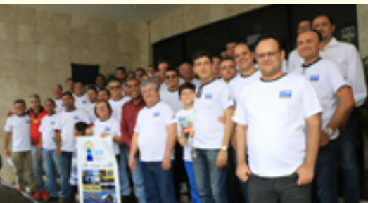
ENCAD PB e RN