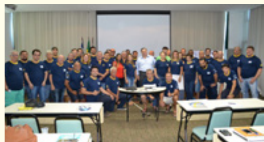
ENCAD ES e RJ