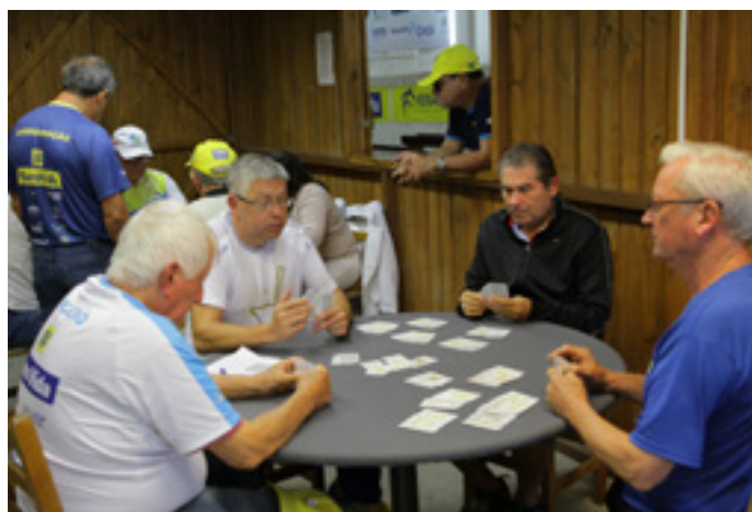
Concentração total no carteadão