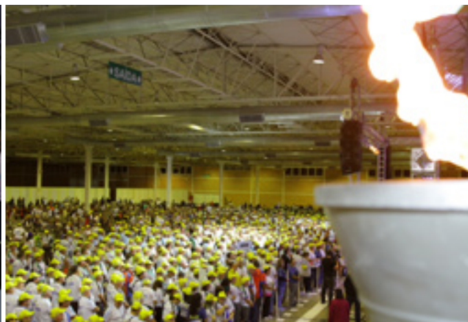
Vista geral das delegações