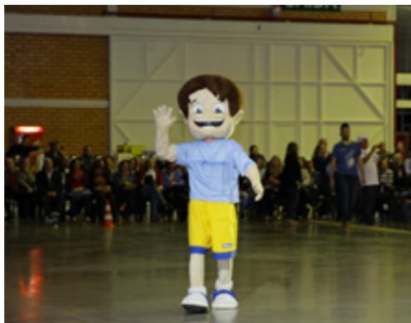
FENABBINHO interage com participantes