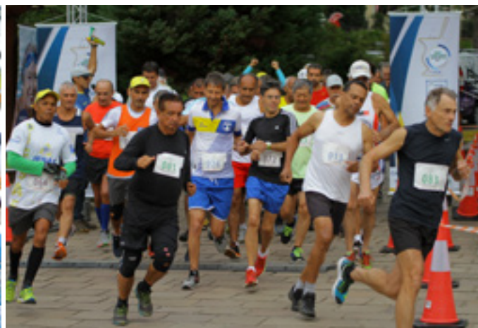
Atletismo no Lago Negro, em Gramado