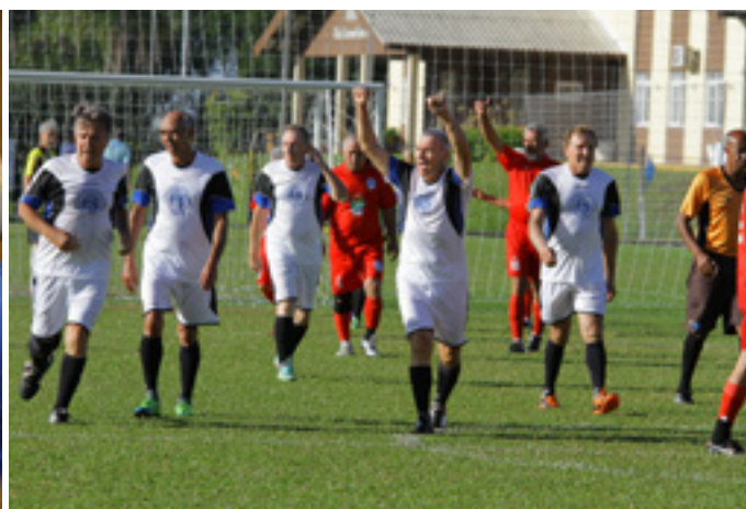
Integração foi a marca das partidas de futebol