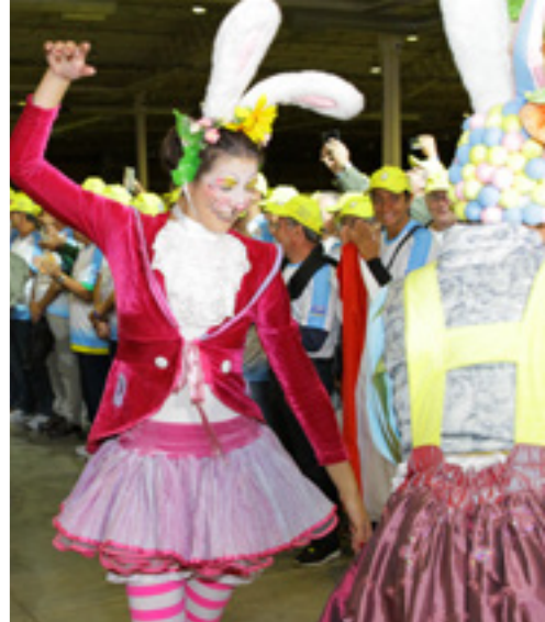
Atrações culturais na abertura do CINFAABB