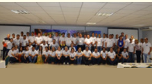
ENCAD GO e TO