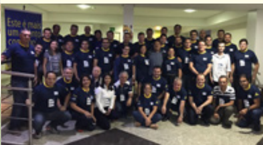
ENCAD MT e RO