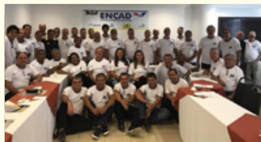
ENCAD PE e AL