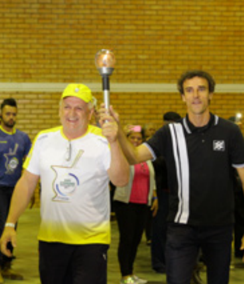
Acendimento da tocha