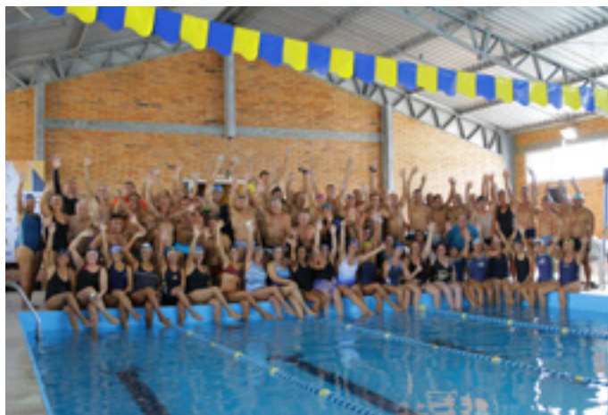
Atletas da natação

Um pouco antes, uma atração regional pra lá de animada iniciou os trabalhos da noite. O cantor Kiko Lemos cantou ritmos variados, indo desde canções tradicionais, passando por músicas internacionais, pagode e rock, intercalando com show de humor que