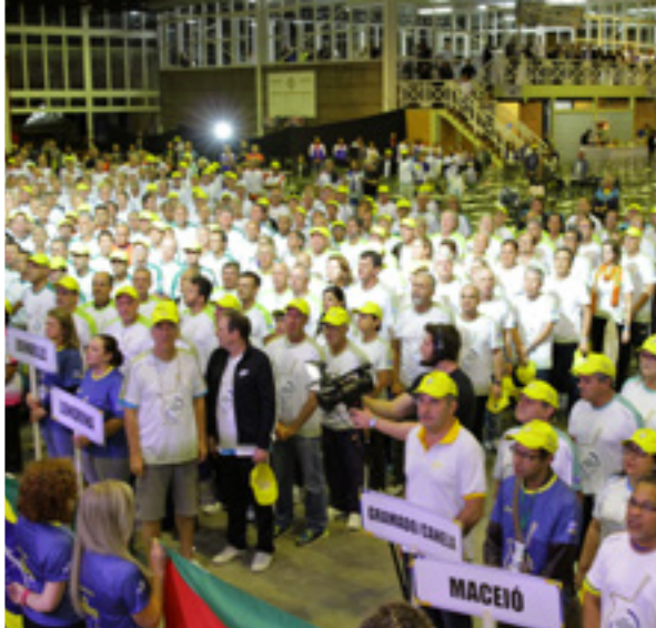
Delegações perfiladas na solenidade de abertura