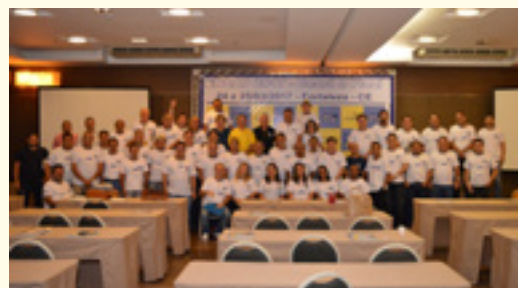
ENCAD CE e PI