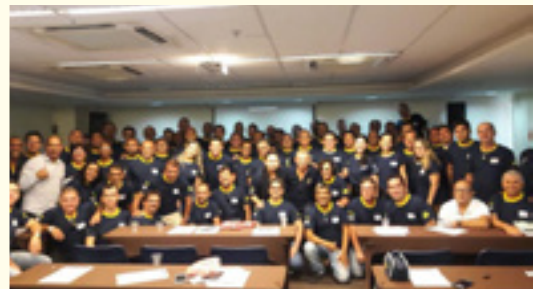
ENCAD BA e SE