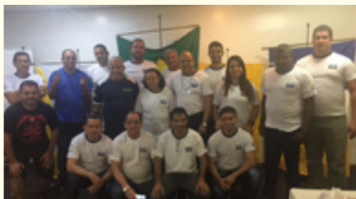
ENCAD AM, RR e AC