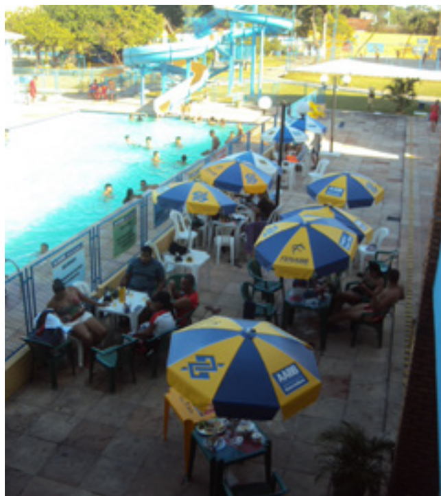
Guarda-sois na AABB Itabuna

Para saber como a FENABB pode contribuir com seu clube, acesse: www.fenabb.org.br/ProgramacaoFENABB .