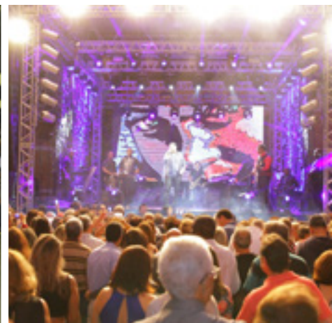
Público compareceu em peso para o show