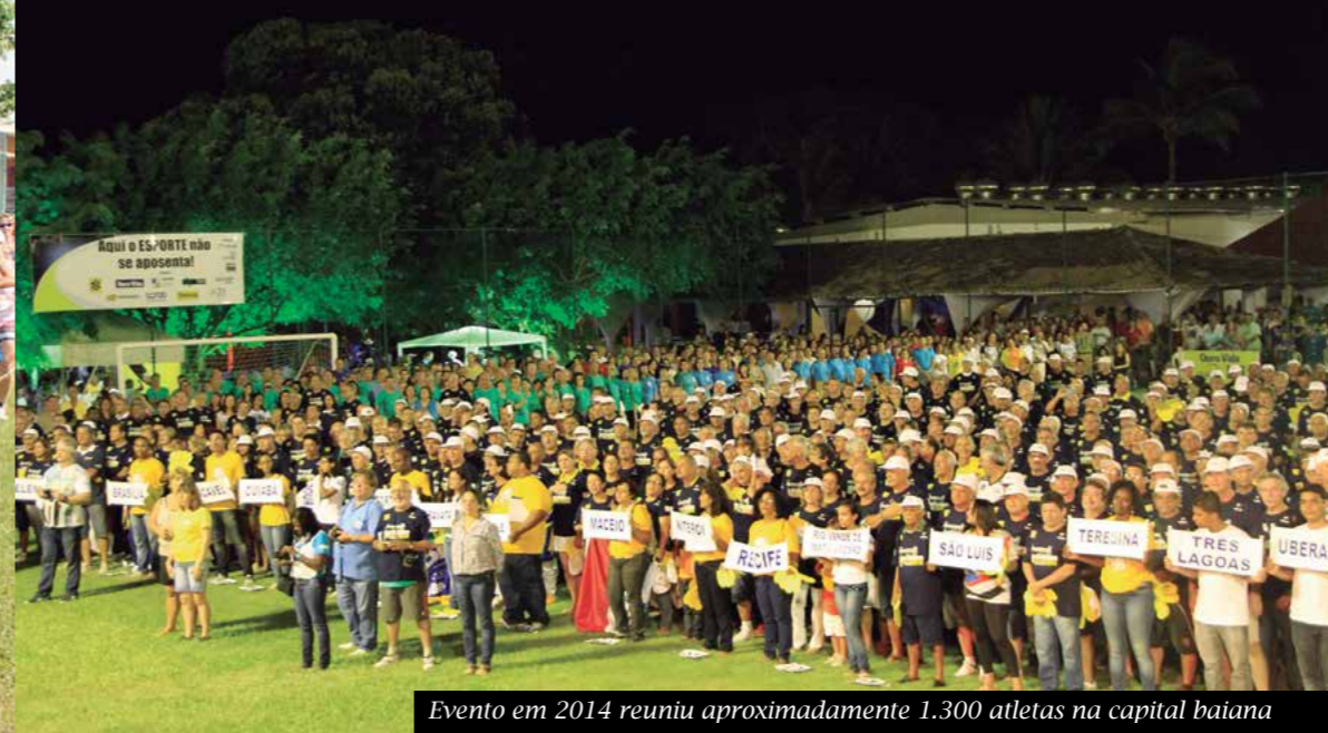
Evento em 2014 reuniu aproximadamente 1.300 atletas na capital baiana