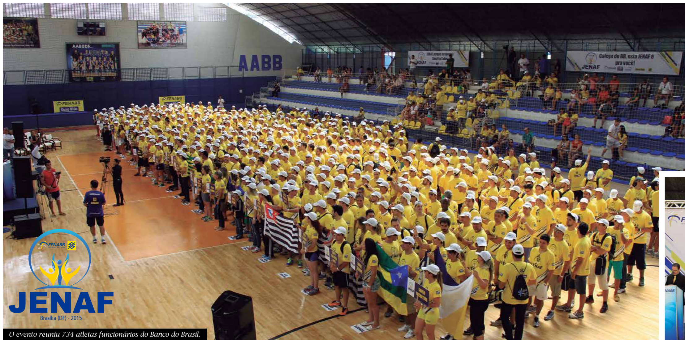
O evento reuniu 734 atletas funcionários do Banco do Brasil.