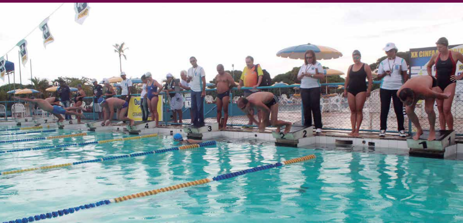
A cada ano, o evento é prestigiado por um embaixador do esporte do BB