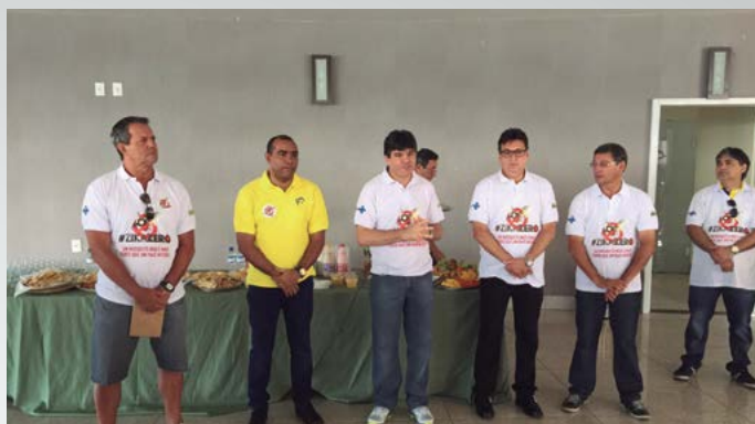
AABB Brasília (DF)