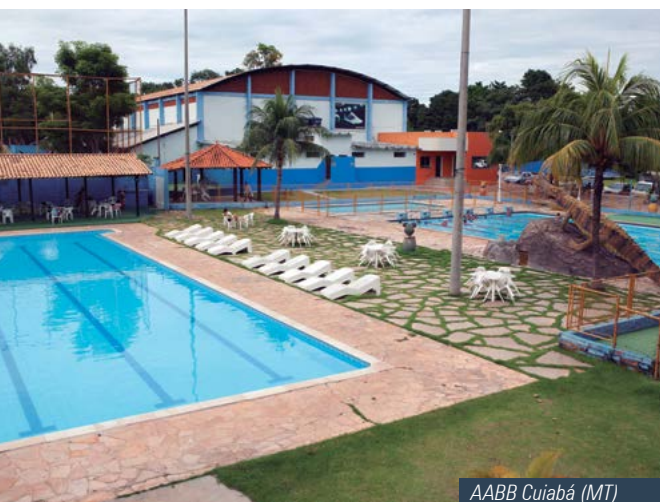
AABB Cuiabá (MT)

Além do verde pantaneiro, a cidade possui área turística peculiar e única. Vale a pena citar que soma, ao menos, 15 Museus, diversas igrejas e templos religiosos. E ainda, espaços ligados ao artesanato e à cultura.