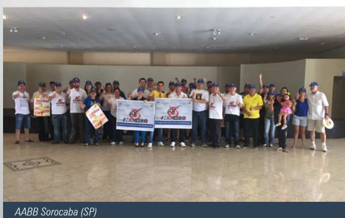
AABB Sorocaba (SP)