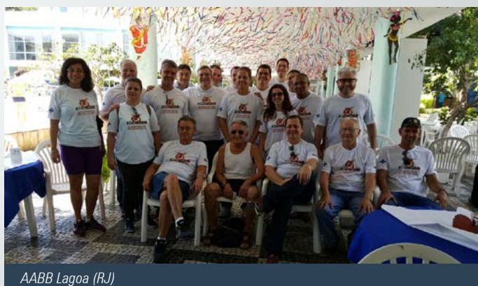
AABB Lagoa (RJ)