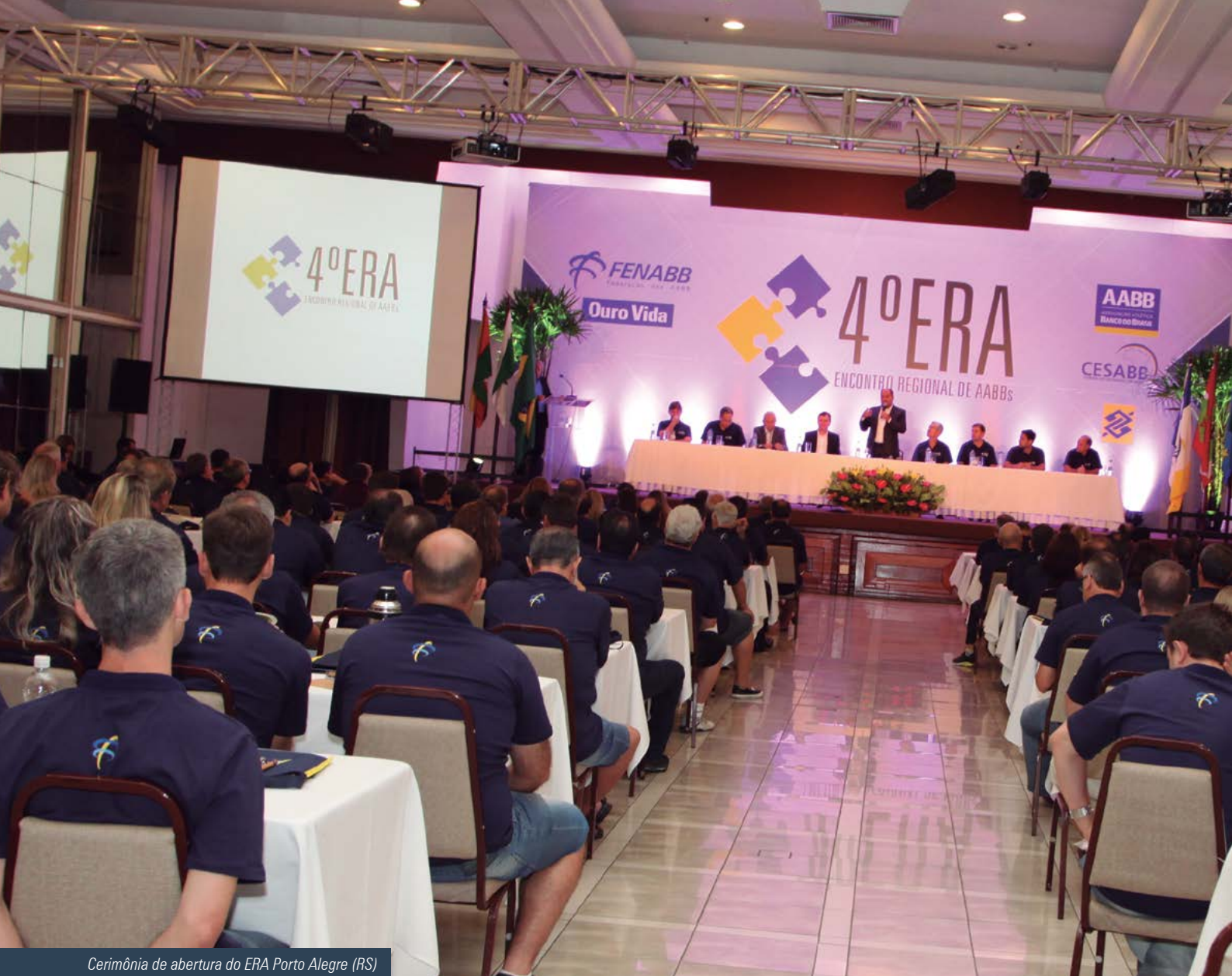
Cerimônia de abertura do ERA Porto Alegre (RS)