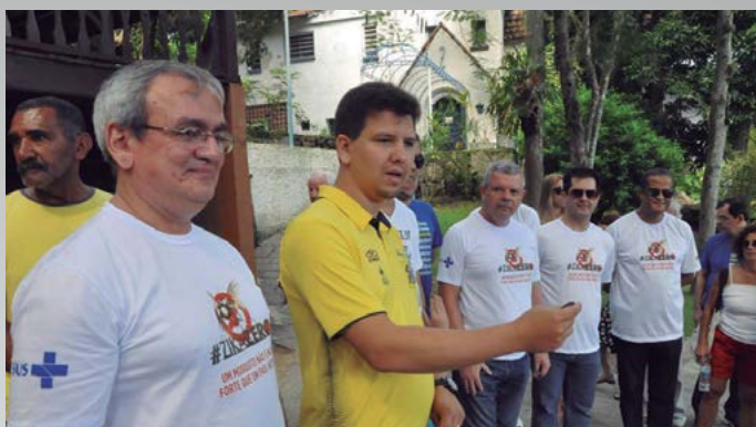
AABB Niterói (RJ)