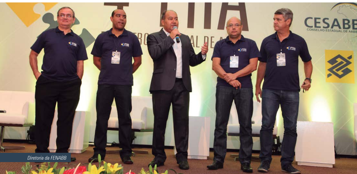
Diretoria da FENABB