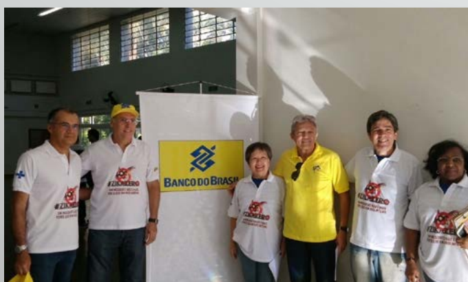
AABB Campinas (SP)