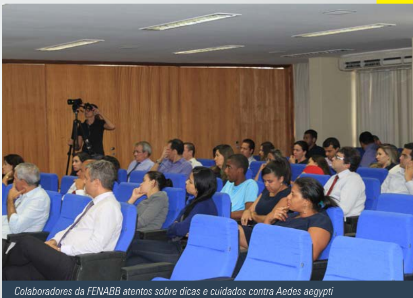
Colaboradores da FENABB atentos sobre dicas e cuidados contra Aedes aegypti

Também esteve nos assuntos abordados, a microcefalia em bebês e maneiras de como lavar recipientes de jardins, locais de possíveis criadouros do mosquito Aedes aegypti .