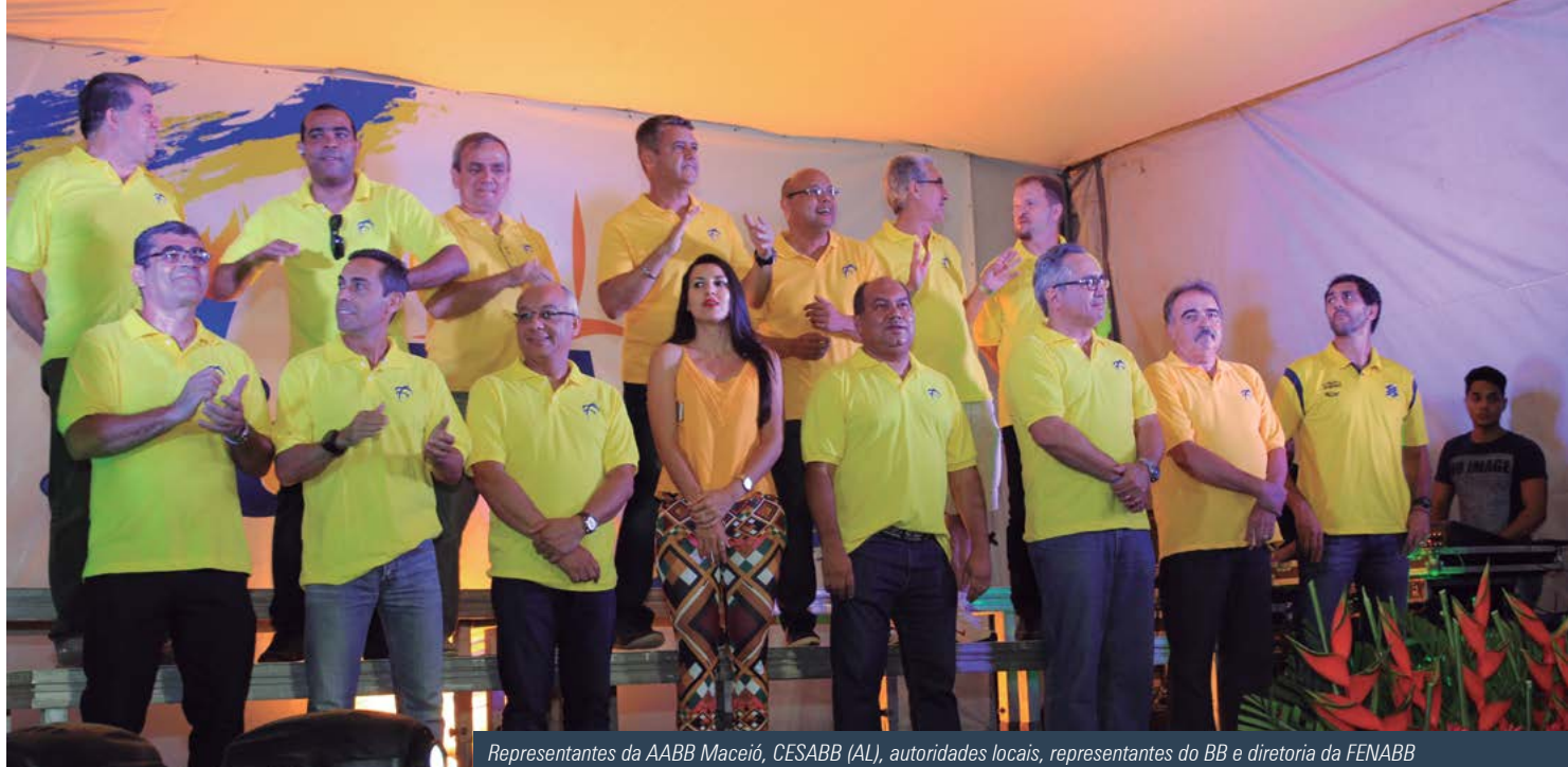
Representantes da AABB Maceió, CESABB (AL), autoridades locais, representantes do BB e diretoria da FENABB

também foi animada pela mascote da FENABB, o Fenabbinho, que esteve durante todo o evento divertindo os participantes e tirando fotos.