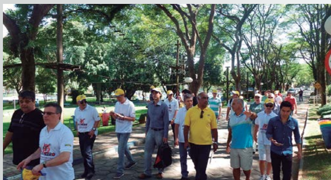
AABB São Paulo (SP)