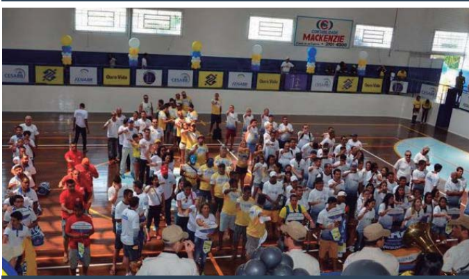
AABB Vitória da Conquista (BA)