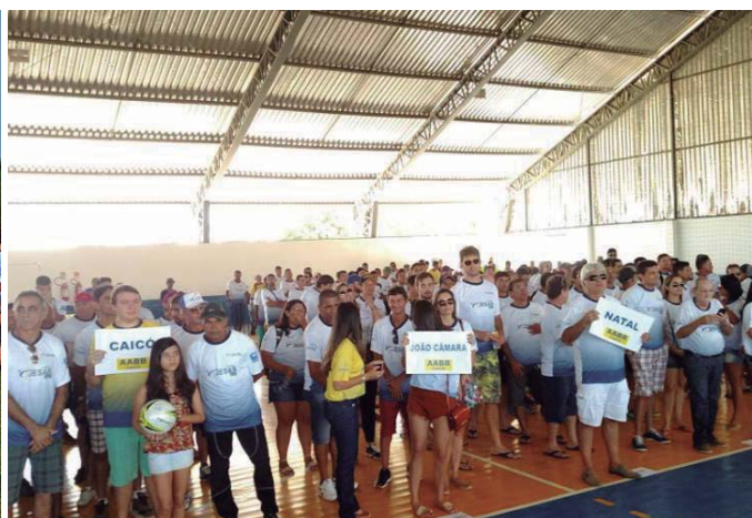
AABB Caicó (RN)