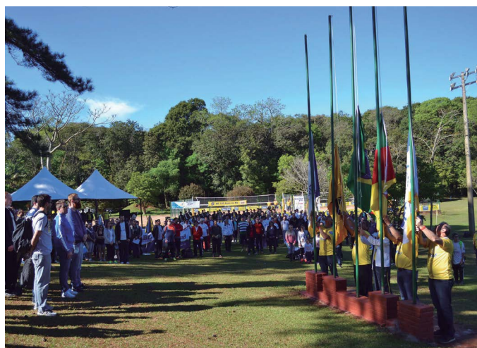
AABB Santa Cruz do Sul (RS)