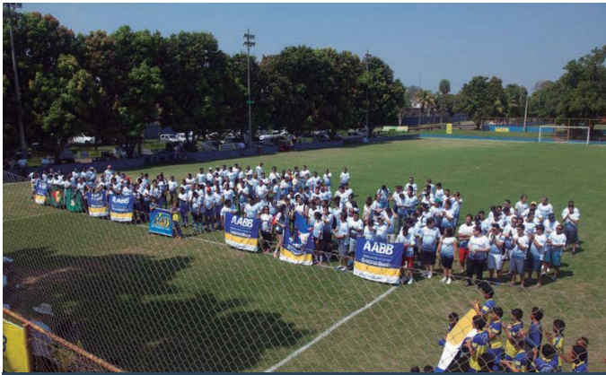
AABB Cuiabá (MT)