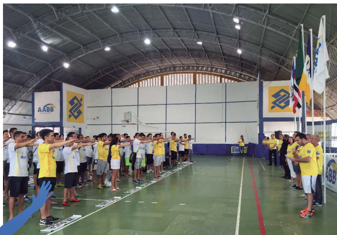
AABB São Luís (MA)