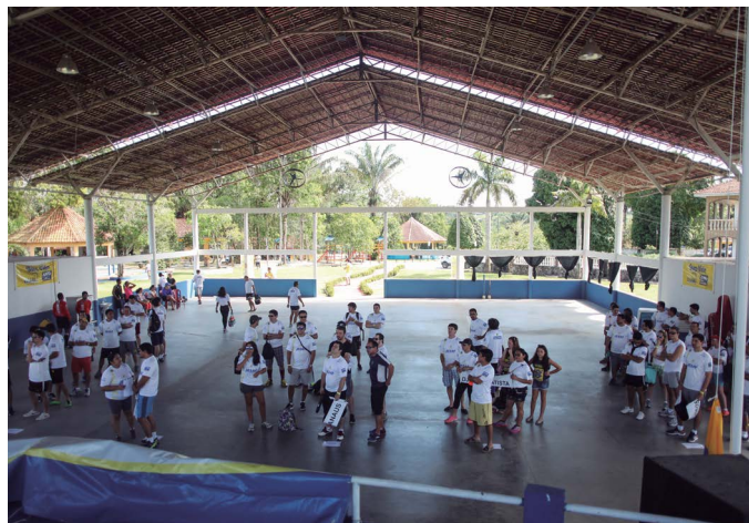
AABB Manaus (AM)