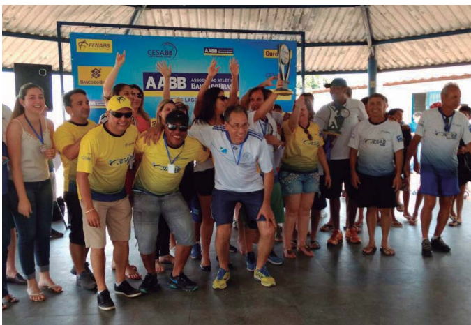
AABB Três Lagoas (MS)