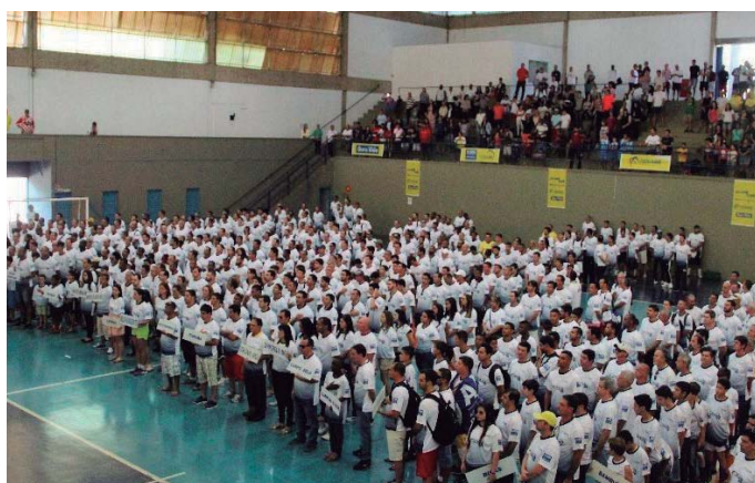
AABB Belo Horizonte (MG)

Juntos, os competidores demonstraram talento nas seguintes modalidades: futebol minicampo (adulto, master e supermaster), futebol de salão, voleibol feminino, vôlei de areia 4x4 misto, vôlei de areia (feminino e masculino), tênis de mesa (feminino e masculino),