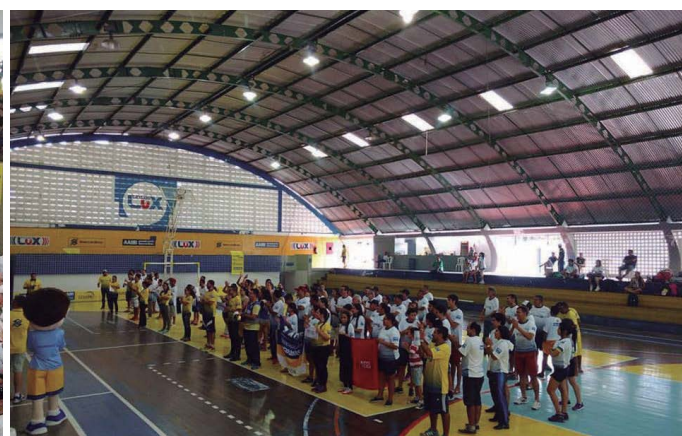
Campina Grande (PB)