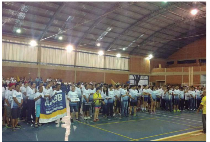
AABB Ribeirão Preto (SP)