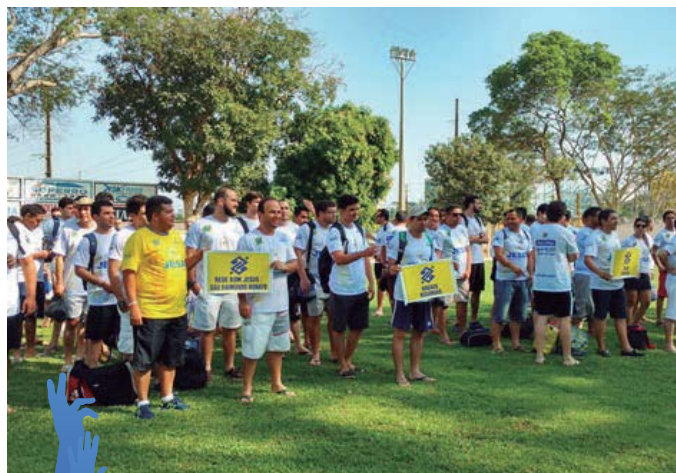
AABB Teresina (PI)