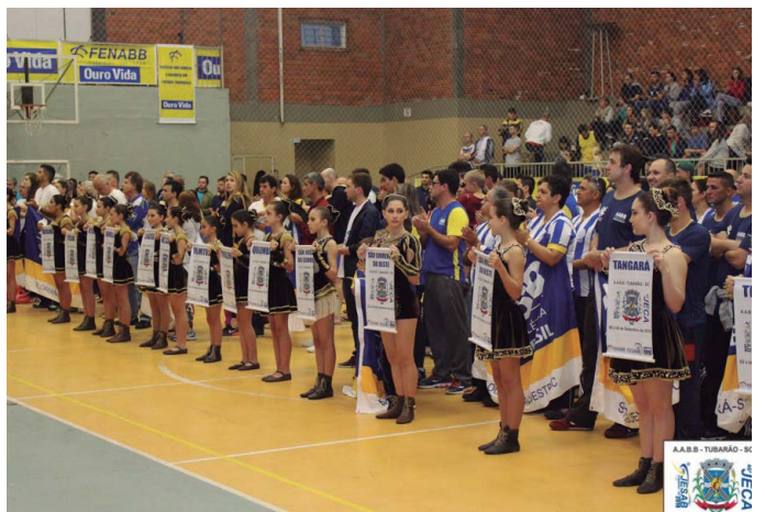
AABB Tubarão (SC)