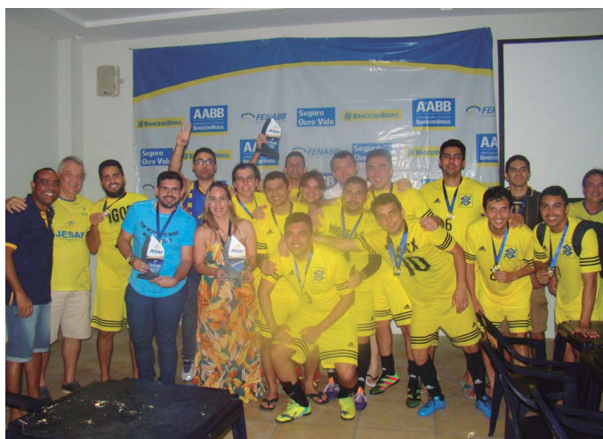
AABB Natal (RN)