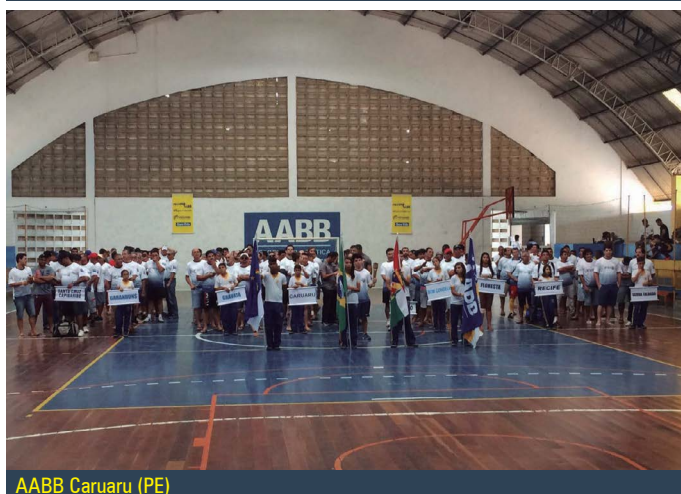
AABB Caruaru (PE)