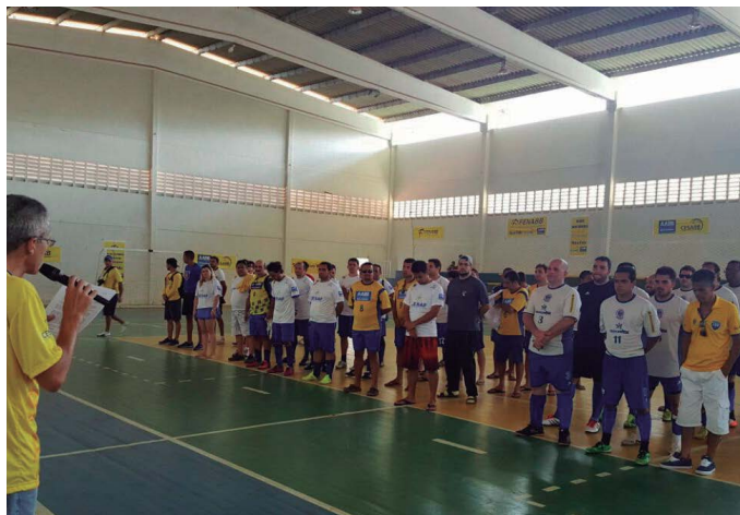
AABB João Pessoa (PB)