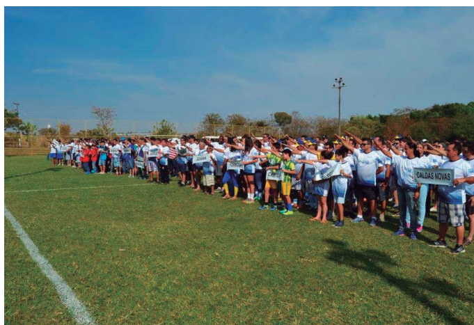
AABB Anápolis (GO)

Até o fim do ano, serão realizadas mais três edições da JESAB. No site da Federação, acompanhe o cronograma de todas Jornadas. Para acessar é fácil, vá ao menu superior do site da FENABB ( www.fenabb.org.br ) > Programas > Esportivos > Cronograma de Jornadas e confira.