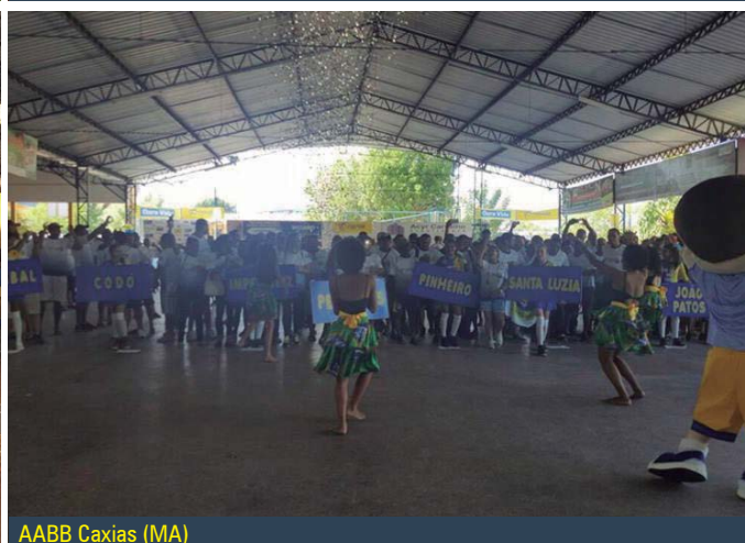
AABB Caxias (MA)