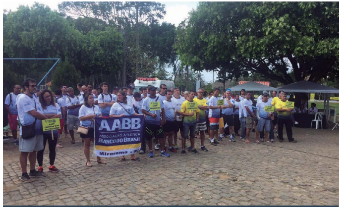
AABB Itaperuna (RJ)