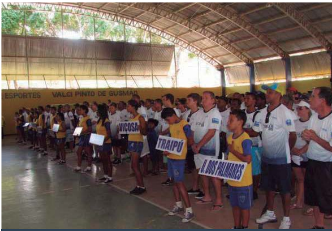
AABB Maceió (AL)