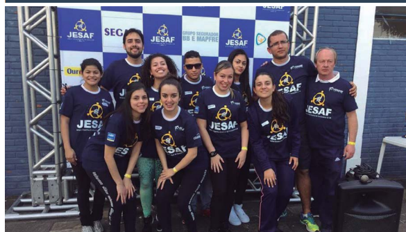
AABB Curitiba (PR)