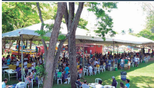
AABB Goiânia (GO)