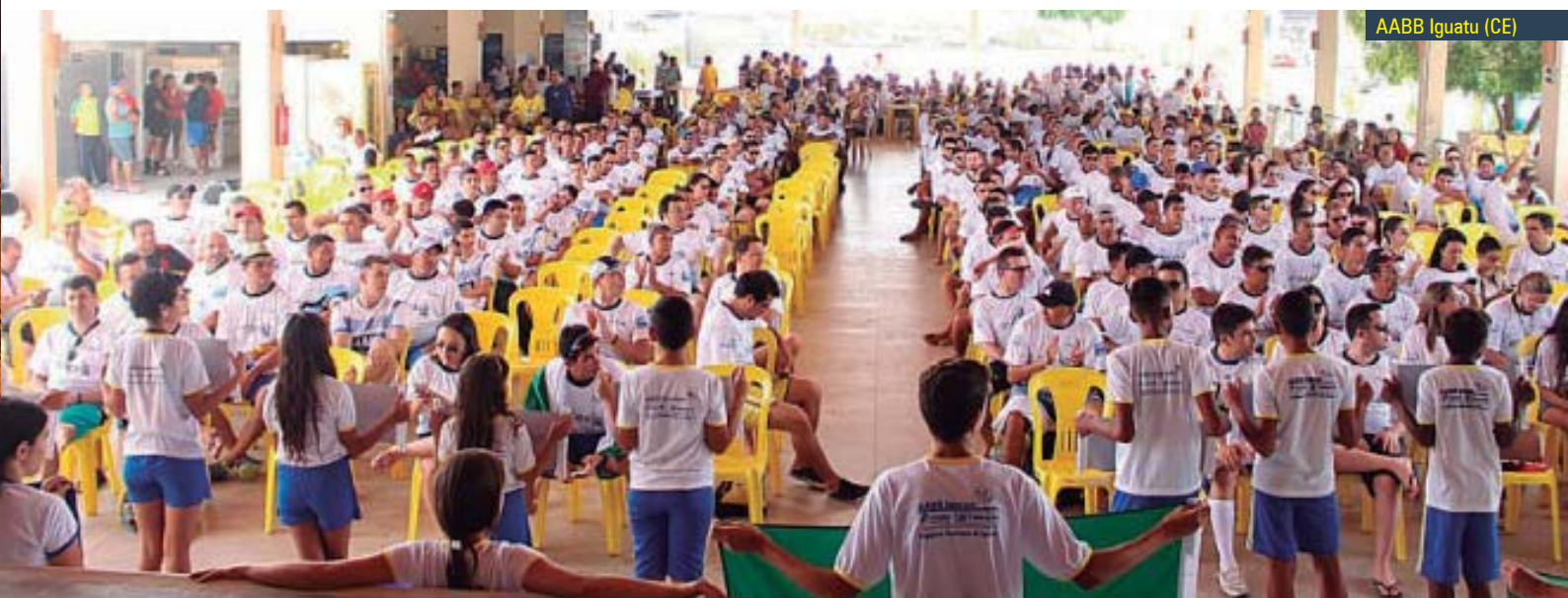
AABB Iguatu (CE)