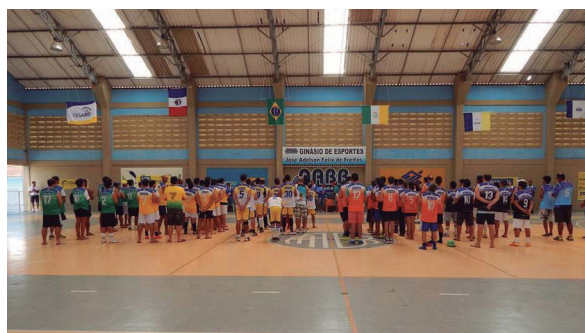
AABB Arapiraca (AL)