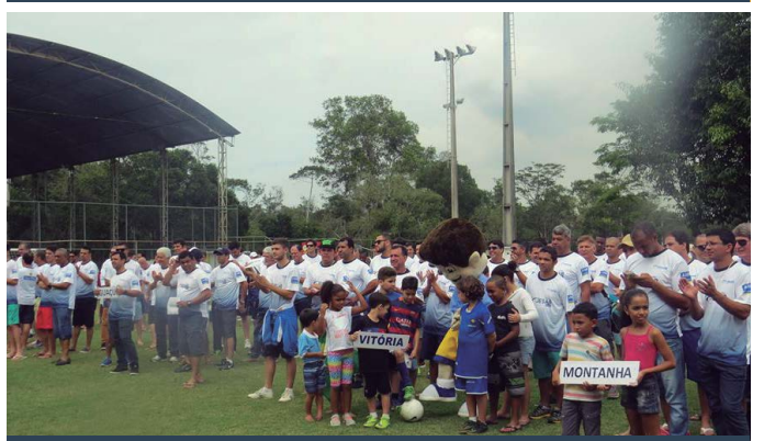
AABB Vitória (ES)